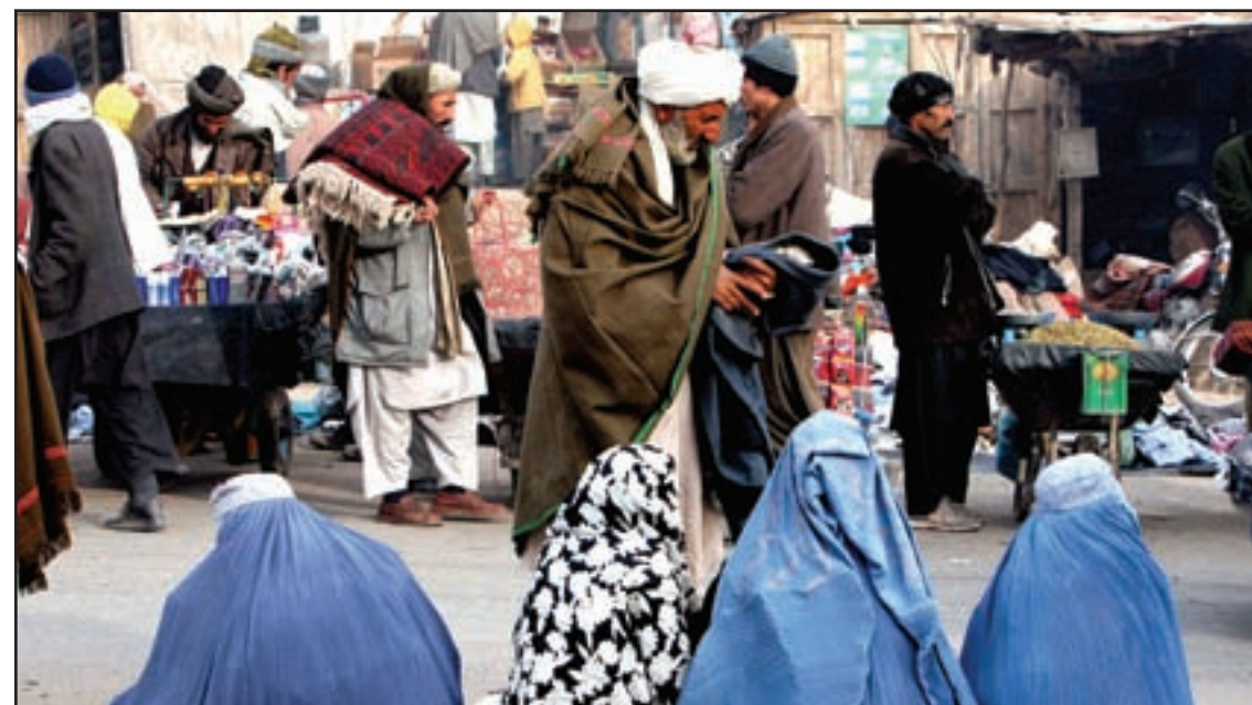
Un homber Afghanistanano ta cumpra material di e muhenan riba un mercado habri den e provincia Heart den west di Afghanistan, diadomingo.